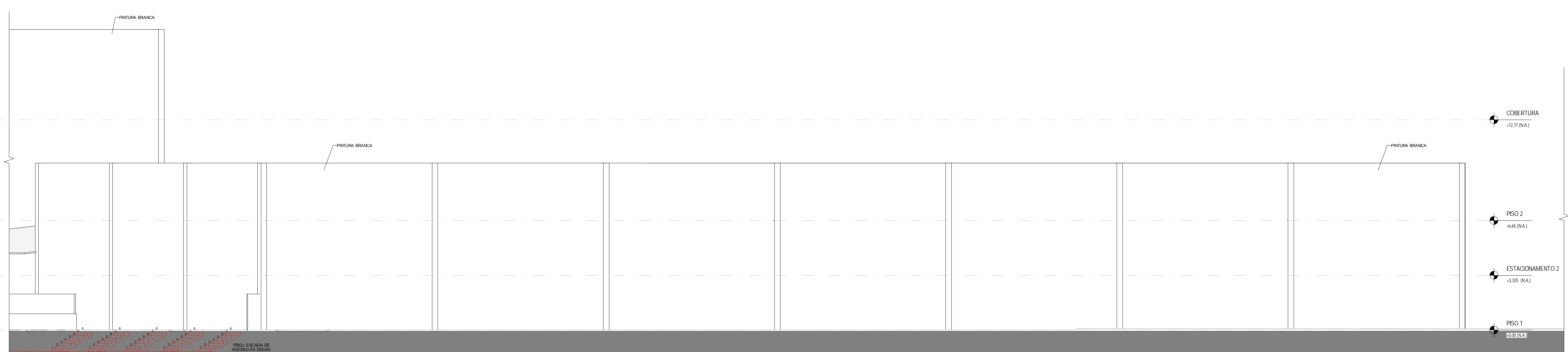
FACHADA POSTERIOR - SEÇÃO 3 1:100